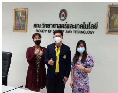
บริจาคโลหิต ฝ่าวิกฤต COVID-19 หนึ่งคนให้ เท่ากับ สามคนรับ